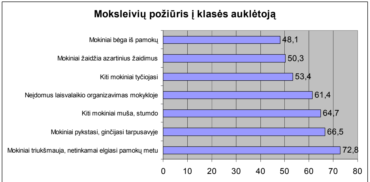
Lentelė Nr.2. Problemos, su kuriomis susidūrę mokiniai, dažniausiai kreipiasi į klasės auklėtoją

Susidūręs su panašiomis problemomis moksleiviai į psichologą ir socialinį pedagogą kreipiasi rečiau.